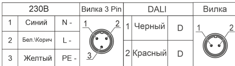
Рисунок 2. Варианты комплектных разъемов.