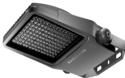
Рисунок 1. Внешний вид светильника