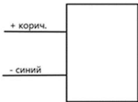
Рисунок 2- Схема подключения к сети постоянного тока (Постоян ток., 3-15 В, 1А)