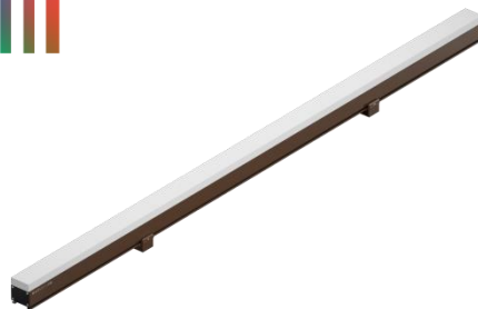
Рисунок 1. Внешний вид светильника

Светильник SOLIS соответствует ТУ 27.40.39-001-28505233-2023, предназначен для архитектурного и ландшафтного освещения. Светильник имеет климатическое исполнение У1 по ГОСТ 15150-69, диапазон рабочих температур от минус 45 °С до плюс 40 °С*, группа условий эксплуатации М2 по ГОСТ 17516.1-90, окружающая среда не взрывоопасная. Светильник имеет класс защиты от поражения электрическим током III. Материал корпуса светильника — алюминий, рассеиватель — акриловое стекло. Светильник не является бытовым электрическим прибором. Общий вид светильника изображен на рисунке 1.