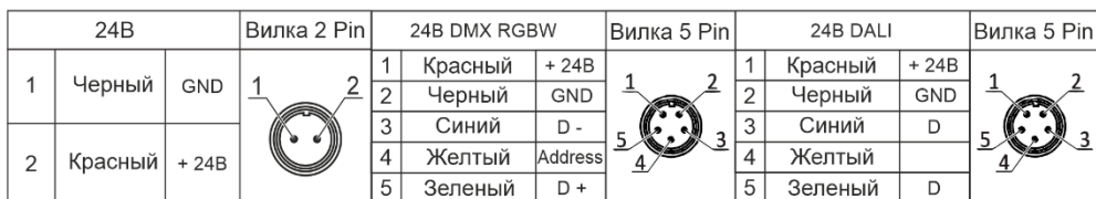
Рисунок 2. Варианты комплектных разъемов.