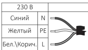
Рисунок 2. Схема подключения питания.