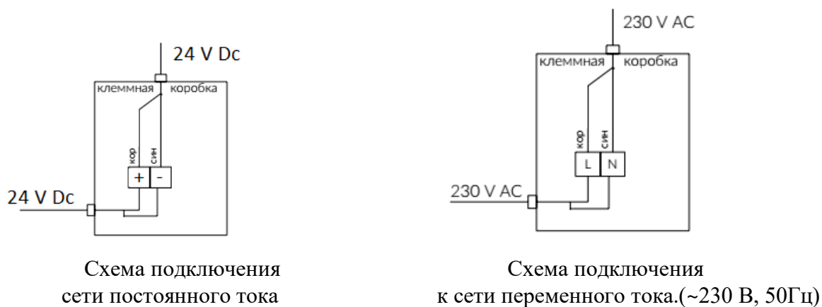
Схема подключения сети постоянного тока

3.3. Произвести подключение светильника согласно электрической схеме: