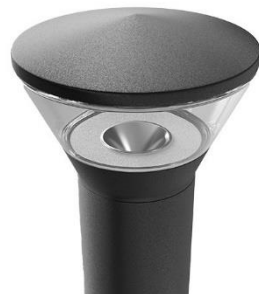
Рисунок 1. Внешний вид светильника

Светильник RAD-STICK соответствует ТУ 27.40.39-003-28505233-2023, предназначен для архитектурного и ландшафтного освещения. Светильник имеет климатическое исполнение У1 по ГОСТ 15150-69, диапазон рабочих температур от минус 45 °С до плюс 40 °С*, группа условий эксплуатации М2 по ГОСТ 17516.1-90, окружающая среда не взрывоопасная. Светильник имеет класс защиты от поражения электрическим током I (для исполнения 230 В). Материал корпуса светильника — алюминий с декоративной панелью, рассеиватель — ПММА. Светильник не является бытовым электрическим прибором. Внешний вид светильника изображен на рисунке 1.