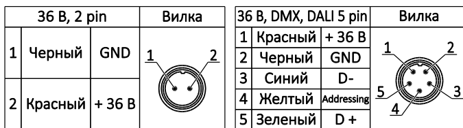
Рисунок 2. Схема подключения к сети постоянного тока.