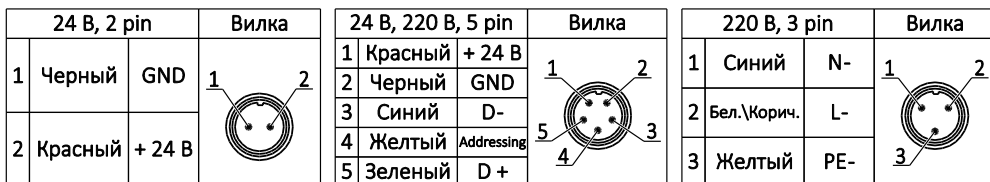
Рисунок 2. Схема подключения питания.