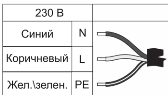
Рисунок 2. Схема подключения питания.