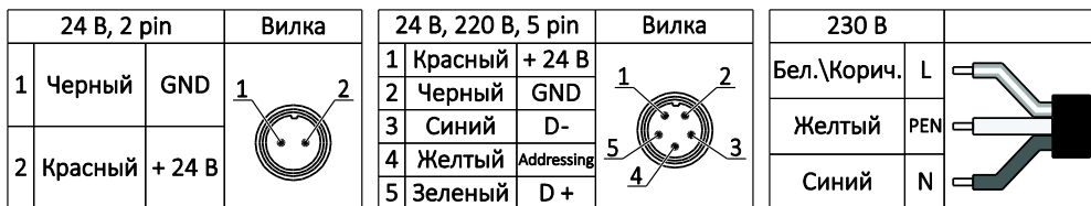
Рисунок 2. Схема подключения питания.