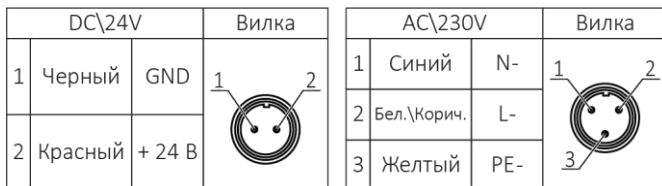
Рисунок 2. Схема подключения питания.

Виды возможных неисправностей светильника и методы их устранения прописаны в таблице 3.